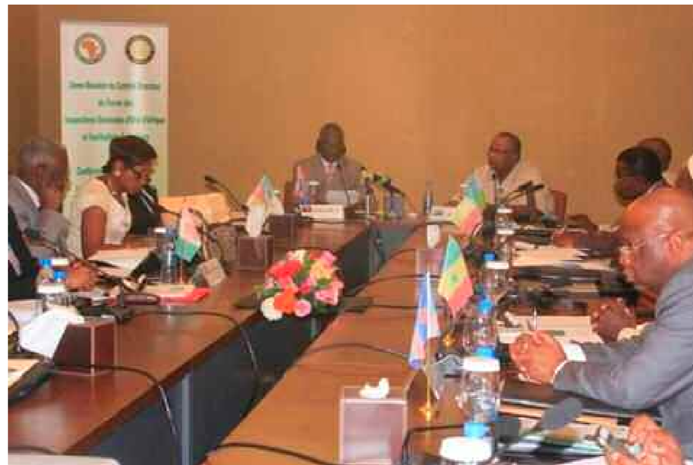
Réunion du Comité Directeur à Djibouti

Conformément aux statuts du FIGE qui stipulent que le Comité Directeur doit se réunir une fois par an à son Siège, l'Inspection générale d'Etat de la République de Djibouti a organisé, du 15 au 16 Avril 2013, la 3 ème réunion du Comité Directeur.