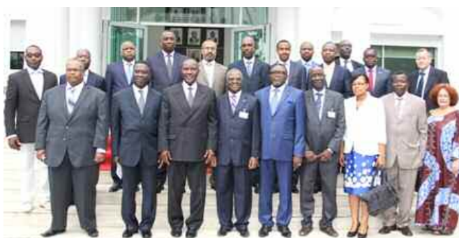
Rencontre avec le Premier Ministre ivoirien

L'inspection générale d'État de la Côte d'Ivoire a abrité du 18 au 22 juin 2013 une réunion extraordinaire du Comité Directeur du FIGE.