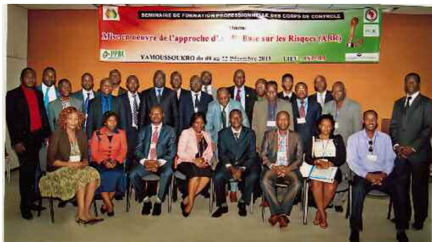
Premier séminaire de l'Institut du FIGE

Huit ans après la création du FIGE et deux ans après l'adoption de la résolution n°17 portant création de l'institut de formation du FIGE, ce dernier a délivré sa première formation le 9 décembre 2013 à Yamoussoukro.