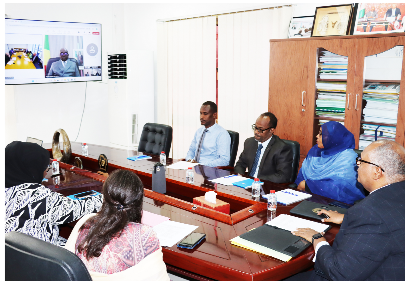
Cérémonie de signature du protocole d'entente entre la Vice-Présidence Intégrité de la Banque Mondiale et le FIGE

Un protocole d'entente sur un partenariat technique a été signé entre la Vice-Présidence Intégrité de la Banque Mondiale et le Forum des Inspections Générales d'Etat d'Afrique et institutions assimilées (FIGE), le 14 mai 2024 lors d'une cérémonie par visioconférence.